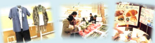
☆これまでの活動内容☆